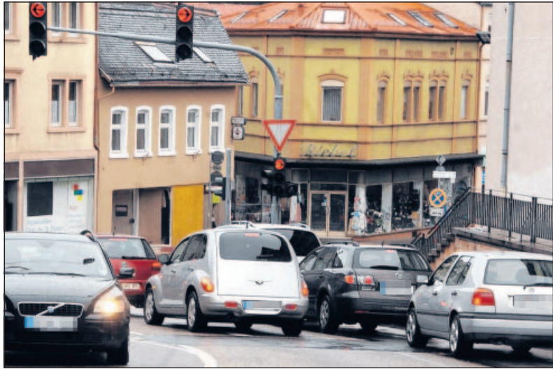
Innenstadtproblem Verkehr: Stau an der Kreuzung Zwackelsbrücke.

INTERVIEW: Zwei Verlegungen und eine Reform, die rund um Neustadt für Unruhe sorgen und auch auf Landesebene kritisch beäugt werden, haben wir zum Anlass genommen, beim rheinland-pfälzischen Innenminister Karl Peter Bruch (62, SPD) nachzuhaken. In Bruchs Mainzer Büro hat Steffen Gierescher mit dem Minister über die umstrittenen Themen Bundesstraße 39, Sportstätten in Lachen-Speyerdorf und Kommunalreform gesprochen.