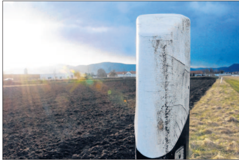
Lachen-Speyerdorf: Platz für neue Sportplätze auf dem Edon-Gelände.